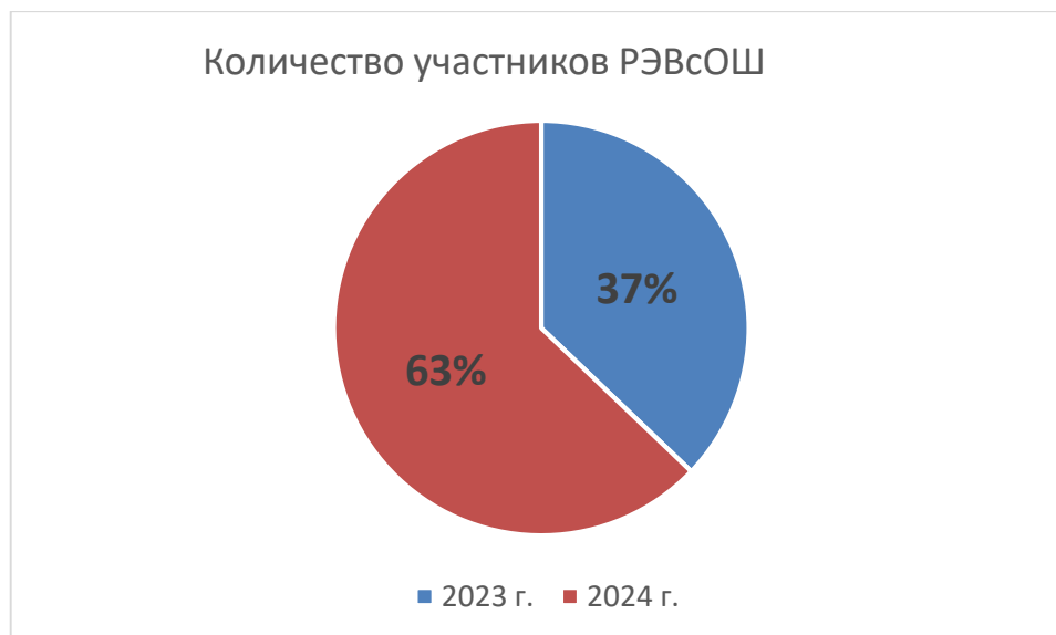
Диаграмма № 1. Количество участников РЭВсОШ в 2023-2024 гг.

В 2024 г. количество набранных участниками баллов распределилось между участниками следующим образом (см. табл. 1).